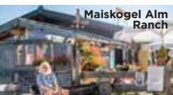
Maiskogel Alm Ranch